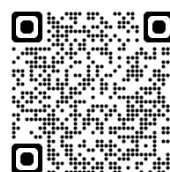
【高等学校等奨学資金関係の様式】