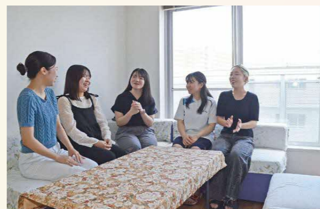
談話室(男女それぞれあり)